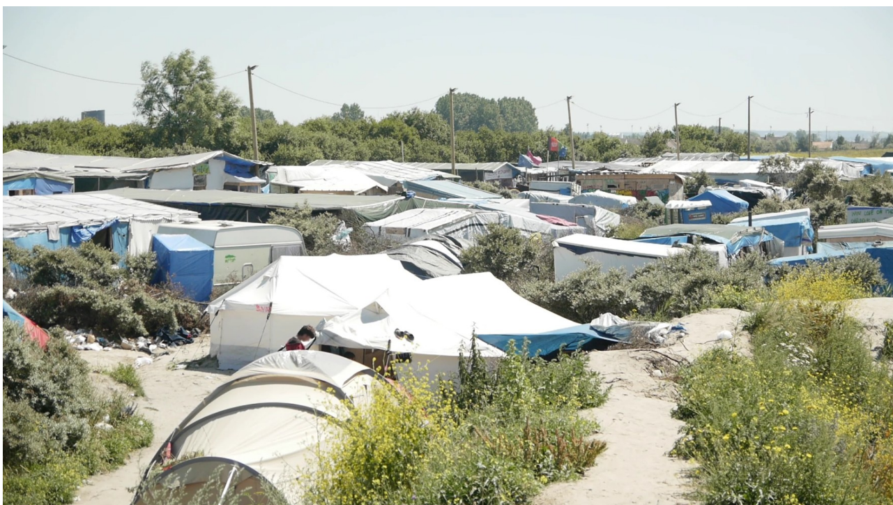
Jungle de Calais, vue de la rue principale (Juillet 2016)

À Calais, il faut passer l' École laïque du Chemin des dunes , laisser sur la droite l' École des Arts et Métiers et poursuivre vers la Jungle Books Library 14 pour atteindre l'entrée de la jungle et sa rue principale. Le bazar est le cœur du camp. Il concentre la majorité des activités : offrant aux réfugiés des lieux pour se restaurer, se reposer, sociabiliser ou trouver un abri tel que le Kids Café ouvert uniquement aux mineurs.