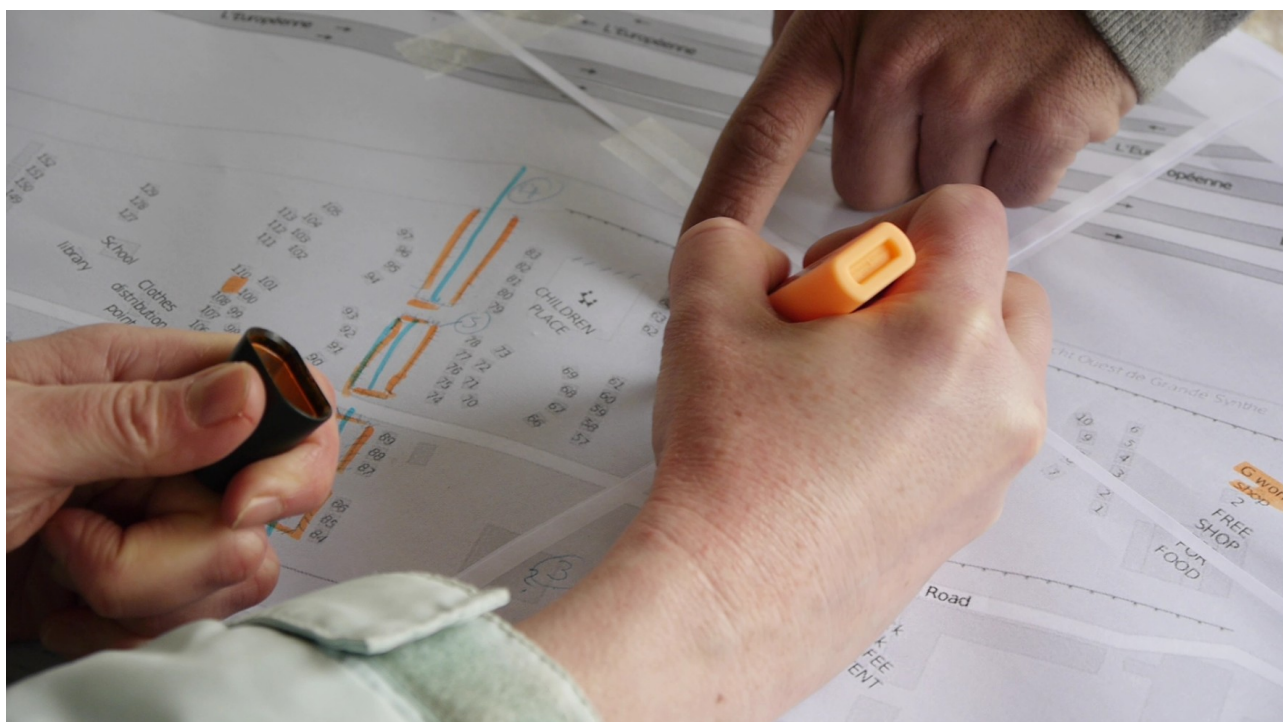
Création de la carte du camp de Grande-Synthe (Avril 2016)

Les réfugiés – en binôme avec un membre de l'équipe – choisissent les zones sur lesquelles ils veulent travailler, comme H. qui part repérer les kitchens qu'il fréquente 20 ou I. qui du haut d'une des grandes dunes de la jungle complète crayon en main sa zone de vie : le quartier qu'il nomme Darfour . Chaque ajout ou modification est géolocalisé via les GPS ou les smartphones 21 de l'équipe, afin de les reporter dans le système d'OpenStreetMap.